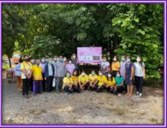
จัดทำป้ายพื้นที่/ผังแสดงเขตพื้นที่ปกปักทรัพยากรท้องถิ่น จำนวน ๑ ป้าย