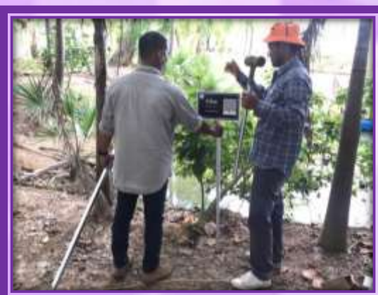
กิจกรรมปักป้ายชื่อพันธุ์ไม้ เมื่อวันที่ ๑ กรกฎาคม ๒๕๖๕ เวลา ๐๙.๐๐ เป็นต้นไป ณ บริเวณพื้นที่ปลูกภัทรพยากรท้องถิ่น (วัดปราณบุรี)