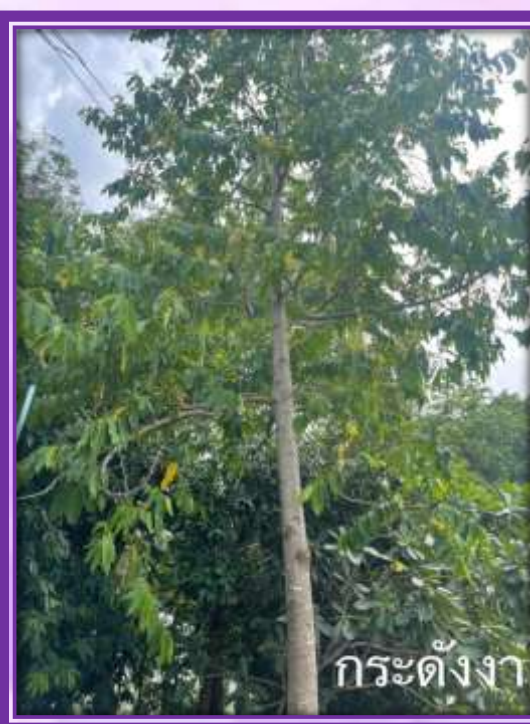
กระดังงา

การสำรวจ/ศึกษาทรัพยากรในพื้นที่ปกปัก เมื่อวันที่ ๑๒ เมษายน ๒๕๖๕ ณ บริเวณพื้นที่ปกปักทรัพยากรท้องถิ่น (วัดปราณบุรี)